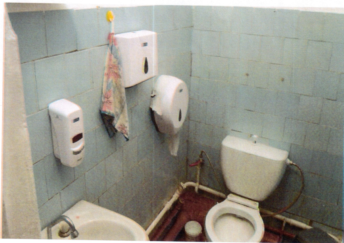
Санитарно – гигиенические помещения