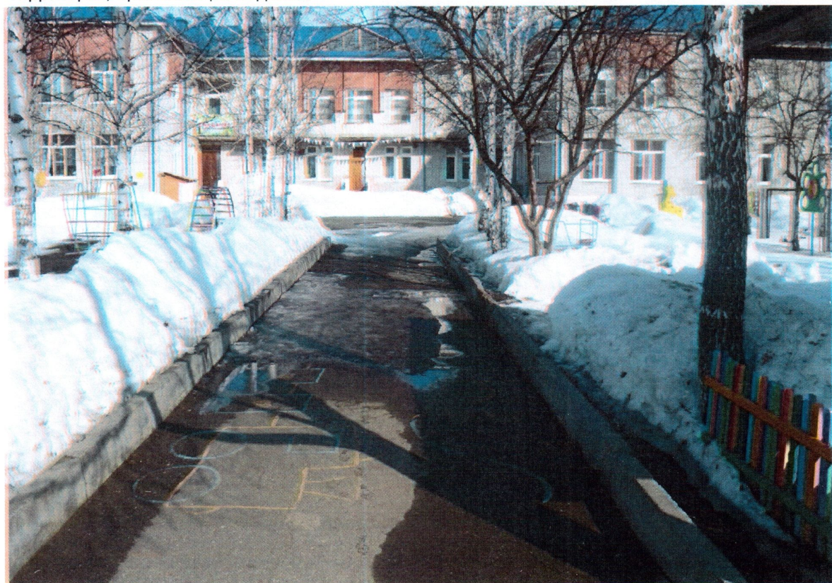
Территория, прилегающая к зданию