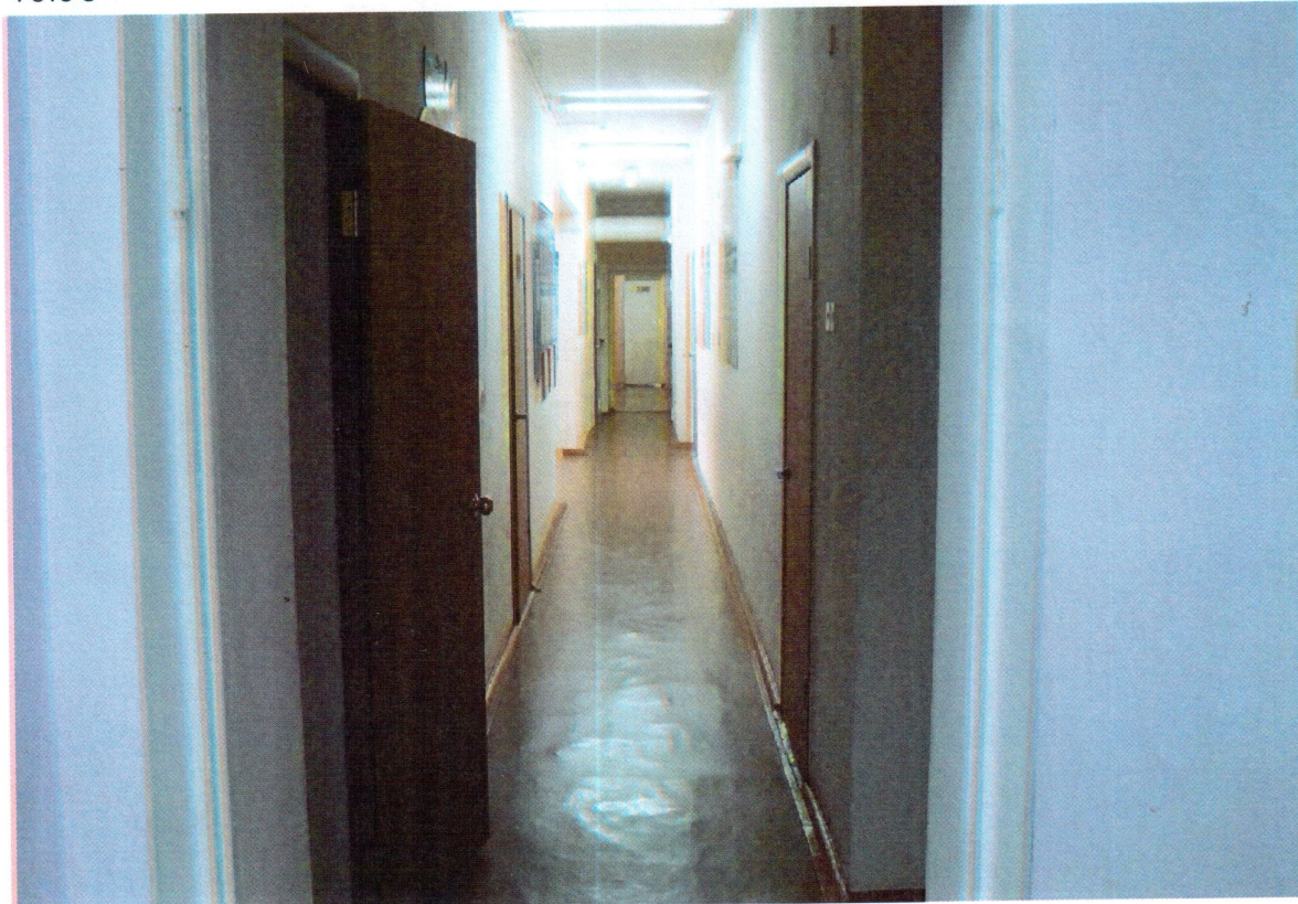
Путь движения внутри здания