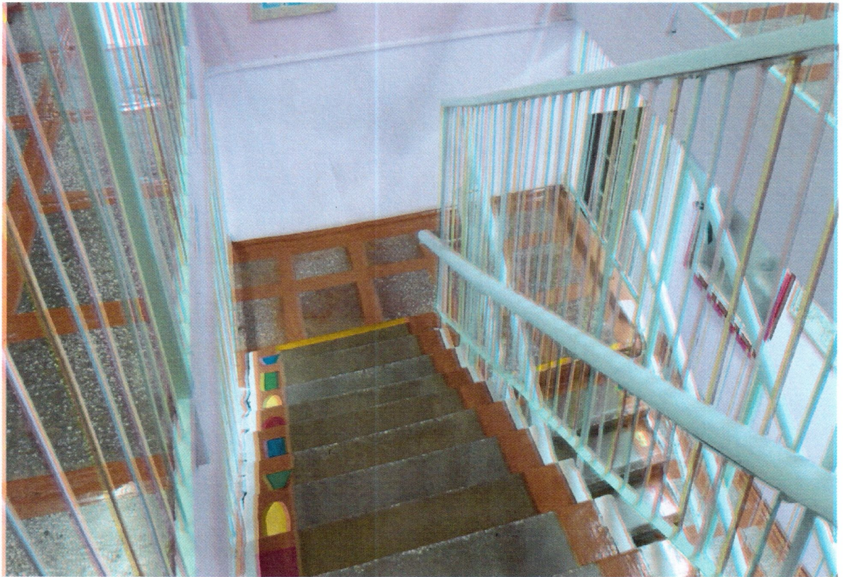
Путь движения внутри здания