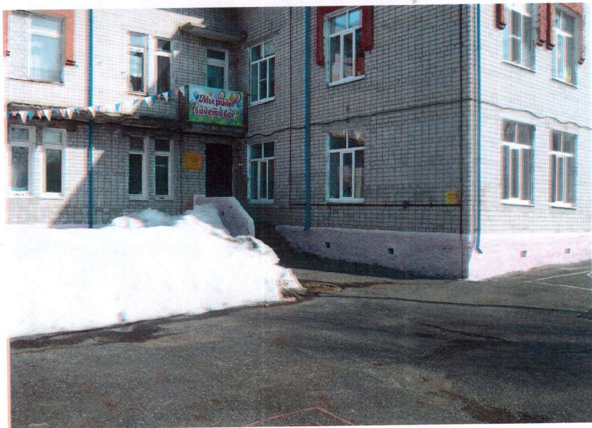
Территория, прилегающая к зданию