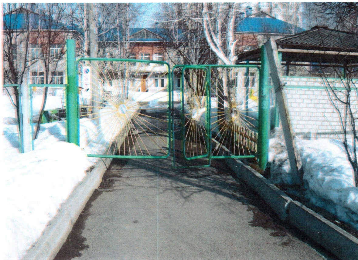
Территория, прилегающая к зданию