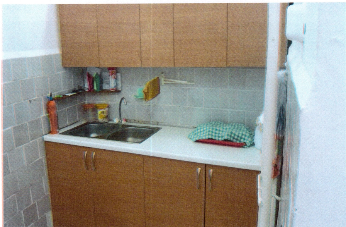
Зона целевого назначения объекта