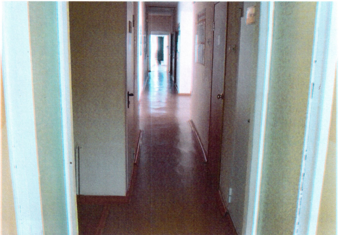
Путь движения внутри здания