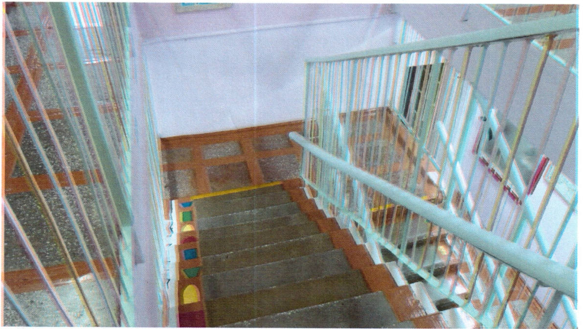
Путь движения внутри здания