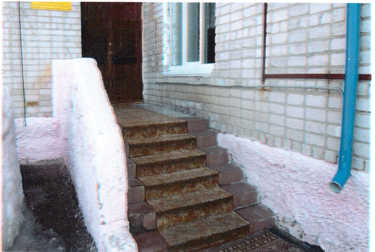
Путь движения к зданию