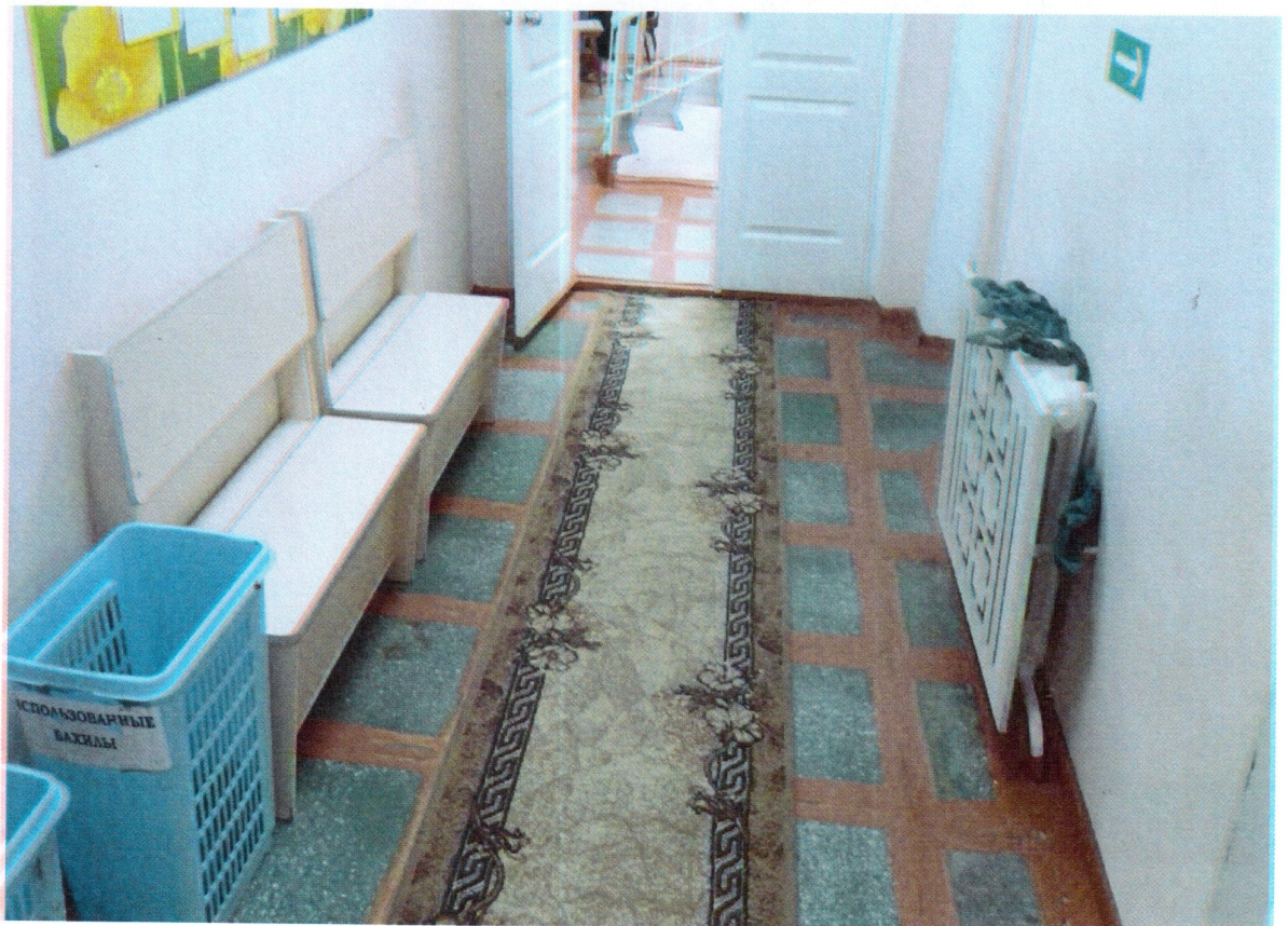
Вход в здание