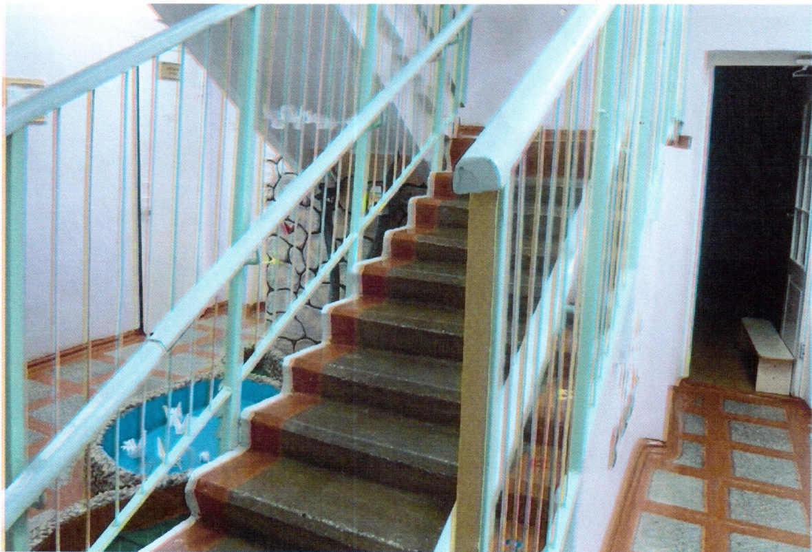
Путь движения внутри здания