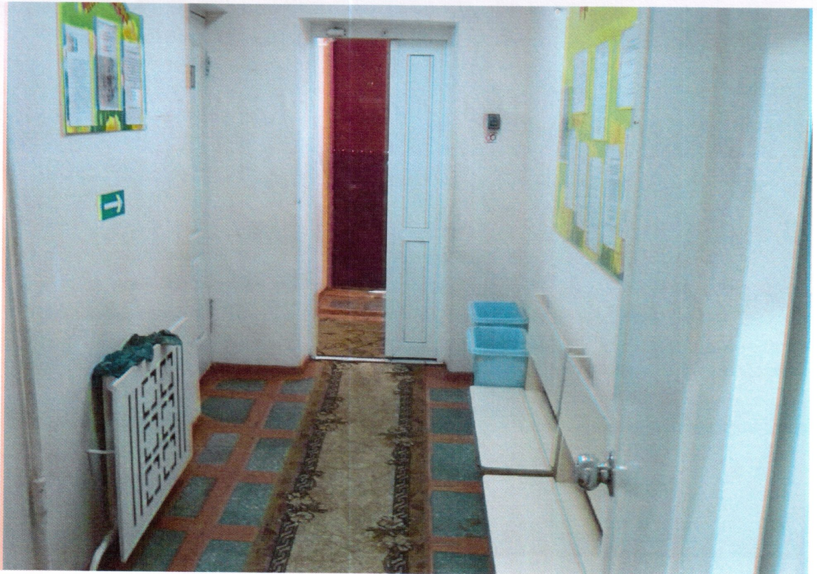
Вход в здание